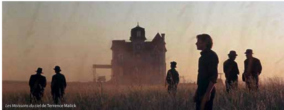
Les Moissons du ciel de Terrence Malick

Parce qu'il est plus important que jamais de soutenir les œuvres, les artistes, les distributeurs, les producteurs, les exploitants, quelques films en avant-première : Frances McDormand, invitée du festival l'an dernier, magnifique dans le nouveau film de Chloé Zhao; absente l'an dernier à l'hommage rendu à son père, Sofia Coppola nous offre son nouveau film, porté par le magnétique Bill Murray; et la cinéaste française Valérie Lemerrier présentera son biopic inspiré de la vie de Céline Dion.