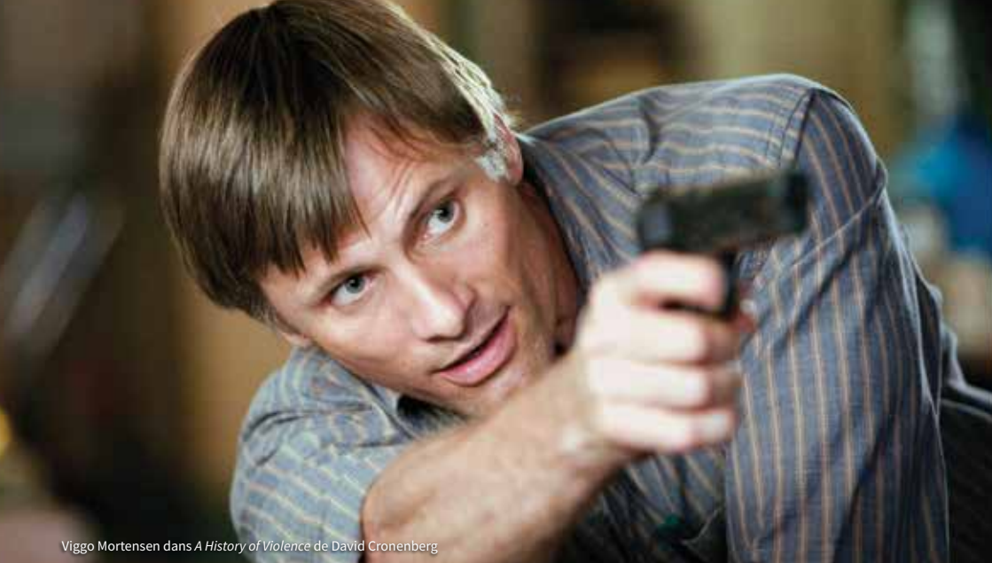
Viggo Mortensen dans A History of Violence de David Cronenberg