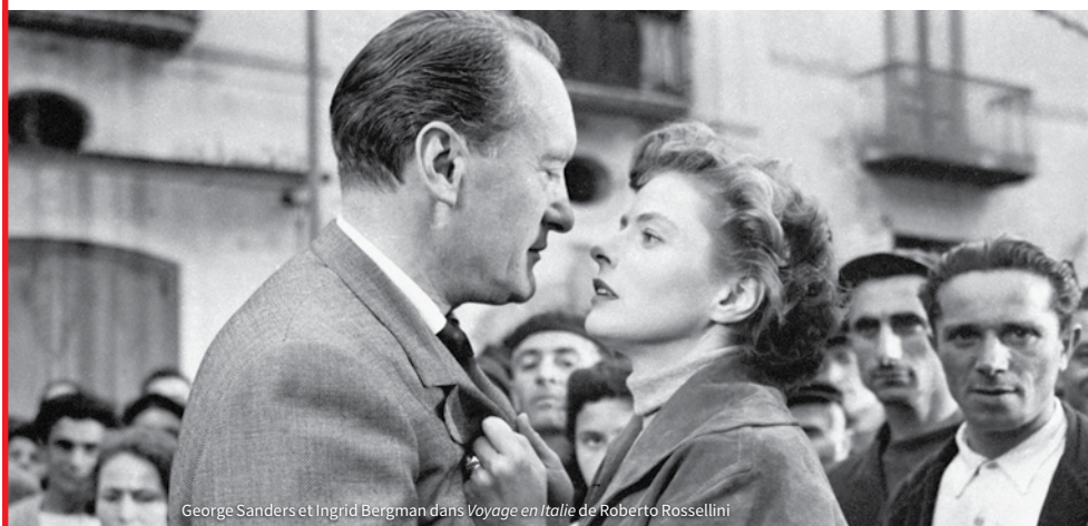
George Sanders et Ingrid Bergman dans Voyage en Italie de Roberto Rossellini

... À enrichir au gré des envies. Retrouvez les notules de tous les films à partir de la page 35.