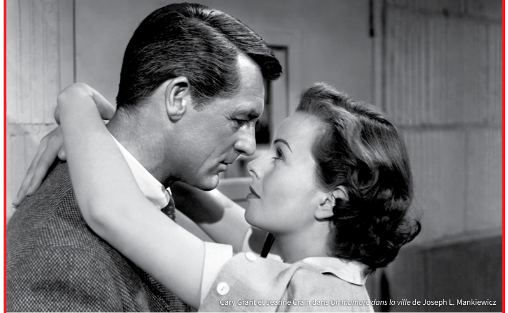
Cary Grant et Jeanne Crain dans On murmure dans la ville de Joseph L. Mankiewicz

Lumière Classics est le label du festival destiné à soutenir – et cette année plus que jamais – une sélection de films restaurés. Ainsi, à l'intérieur du festival, des films restaurés et apportés par des archives, des producteurs, des ayants-droits, des distributeurs, des studios et des cinémathèques bénéficient d'un écran particulier.