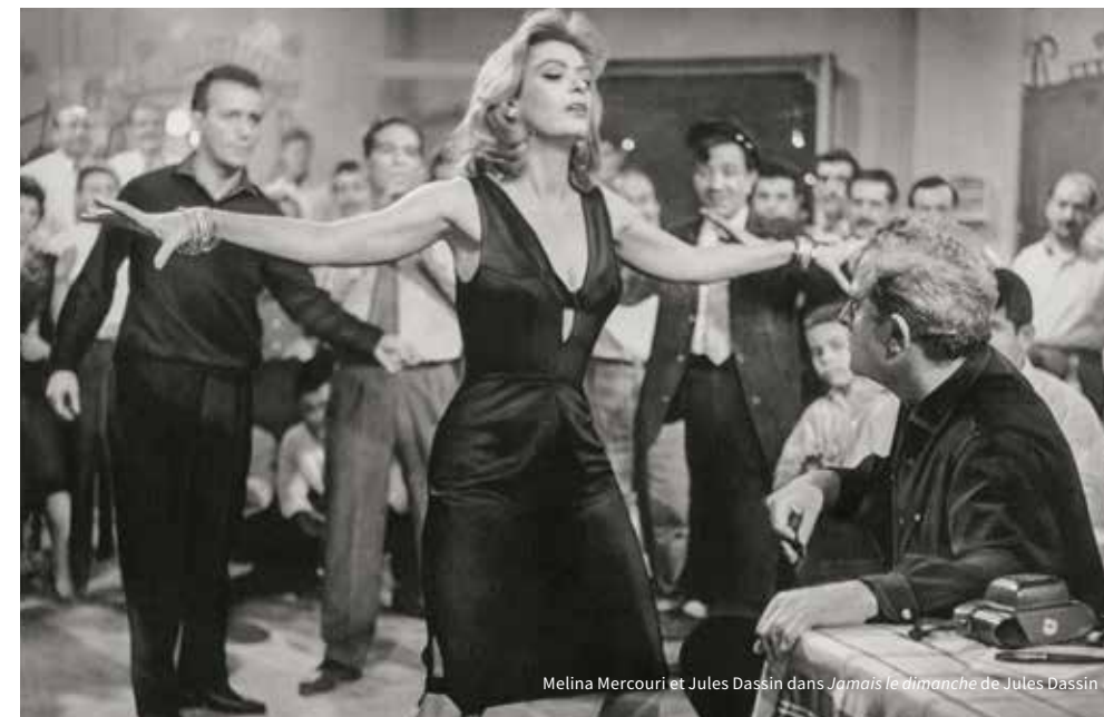
Melina Mercouri et Jules Dassin dans Jamais le dimanche de Jules Dassin

Dans le cadre du centenaire de sa naissance, le festival Lumière rend hommage à l'actrice grecque aux charmes bouillonnants, devenue, par la suite, femme politique et défenseuse de la culture européenne. Hommage porté et accompagné par l'exceptionnelle Nana Mouskouri.