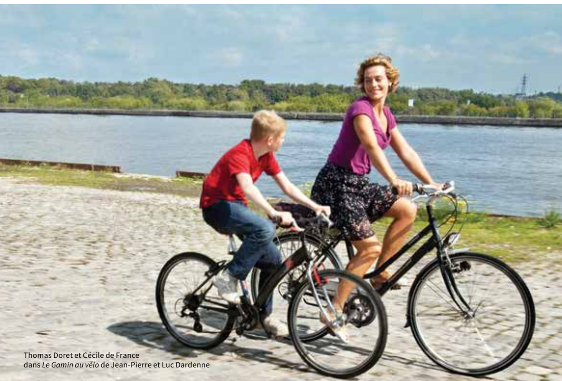
Thomas Doret et Cécile de France dans Le Gamin au vélo de Jean-Pierre et Luc Dardenne