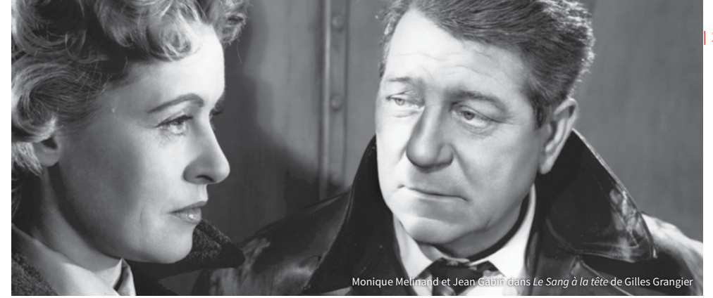
Monique Mélinand et Jean Gabin dans Le Sang à la tête de Gilles Grangier